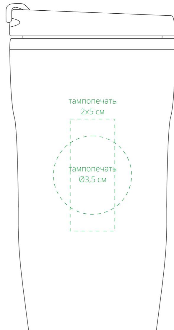
справа от поильника