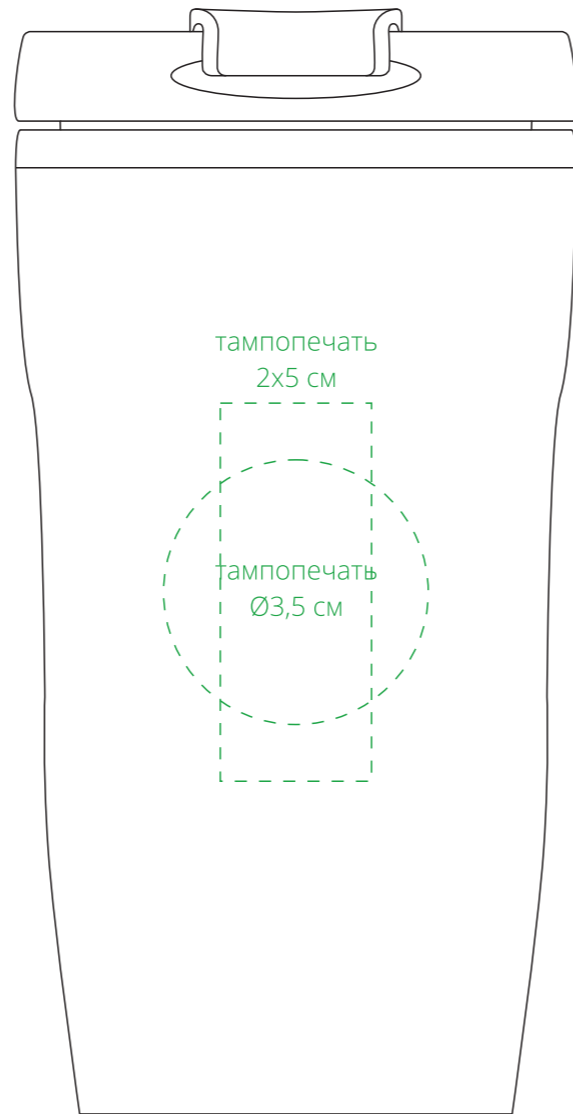
сторона с поильником